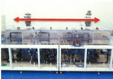
コンベア正・逆転 OK 扉開閉 OK