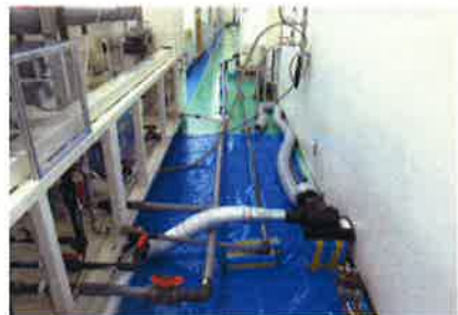
仮配管にて動作確認