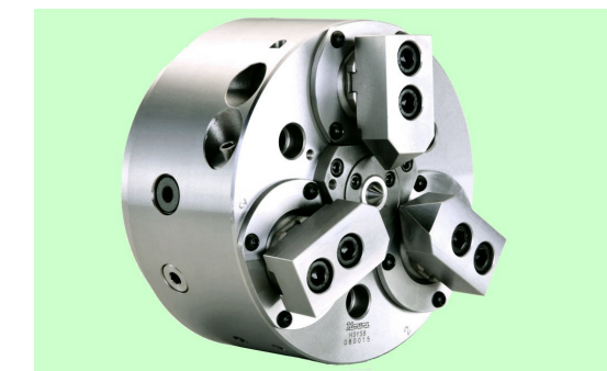
把握爪は付属しておりません。Top jaws are not attached to this chuck.