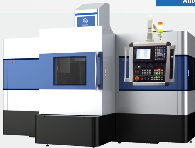
自動測定 Automatically measure