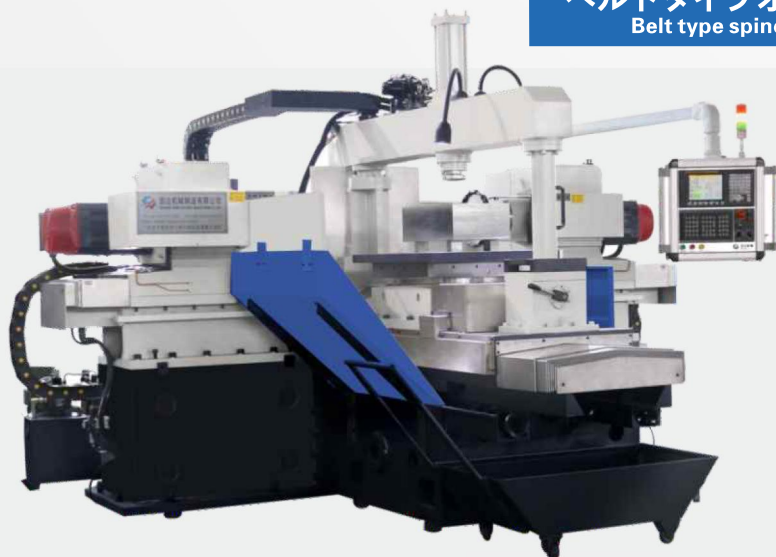
ベルトタイプオプション Belt type spindle(OP.)