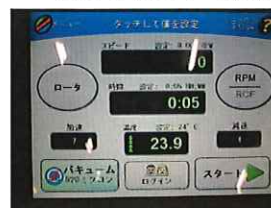
図5. バキューム確認