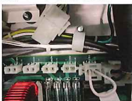
図1. 電圧選択ジャンパー変更