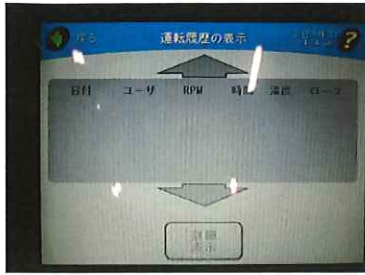
図6. 各パラメーター確認